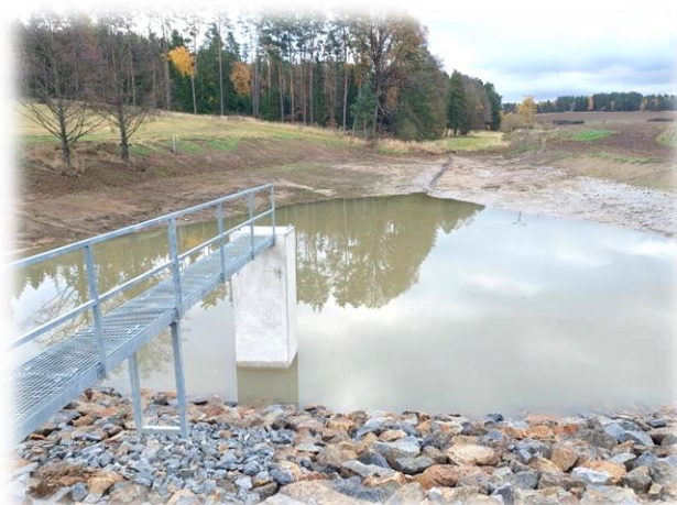
malý myslivecký rybník – Doubravka – velký myslivecký rybník