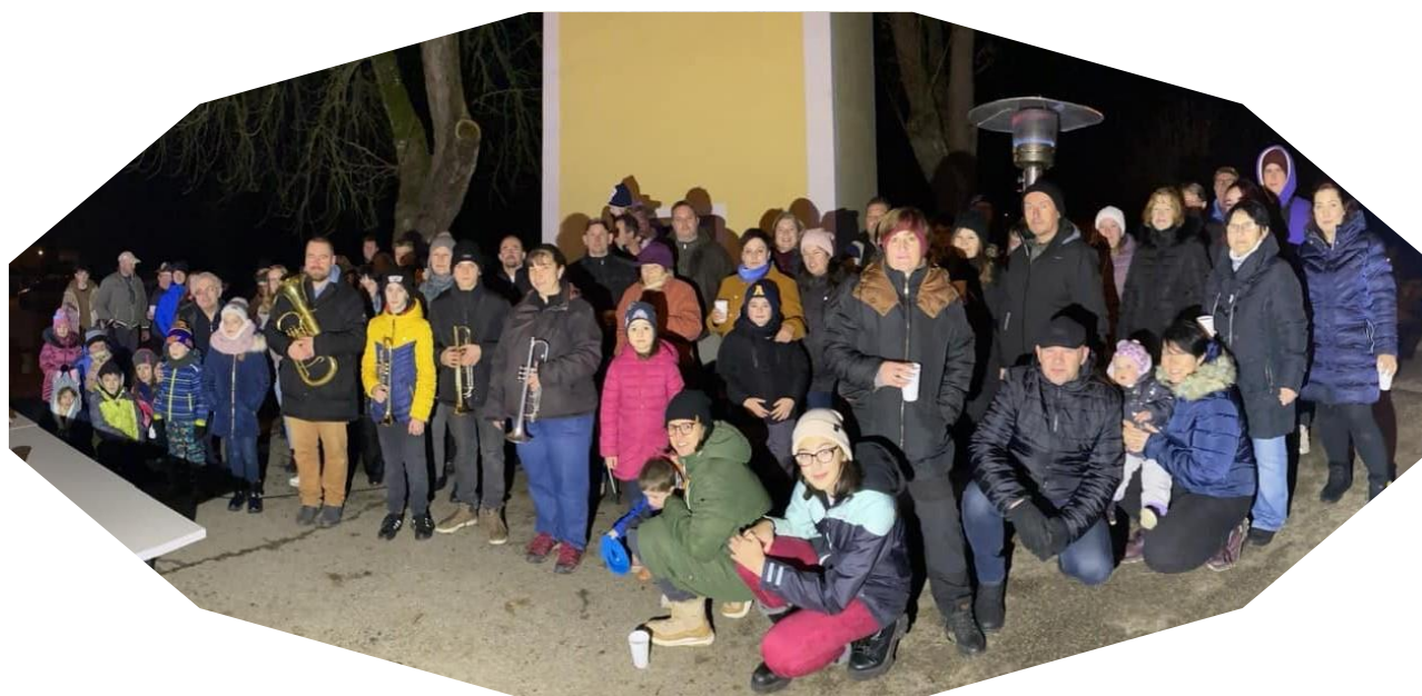
adventní setkání u kapličky v Koloměřicích