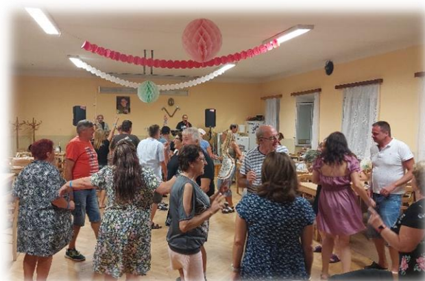
Rybí hody v Doubravě