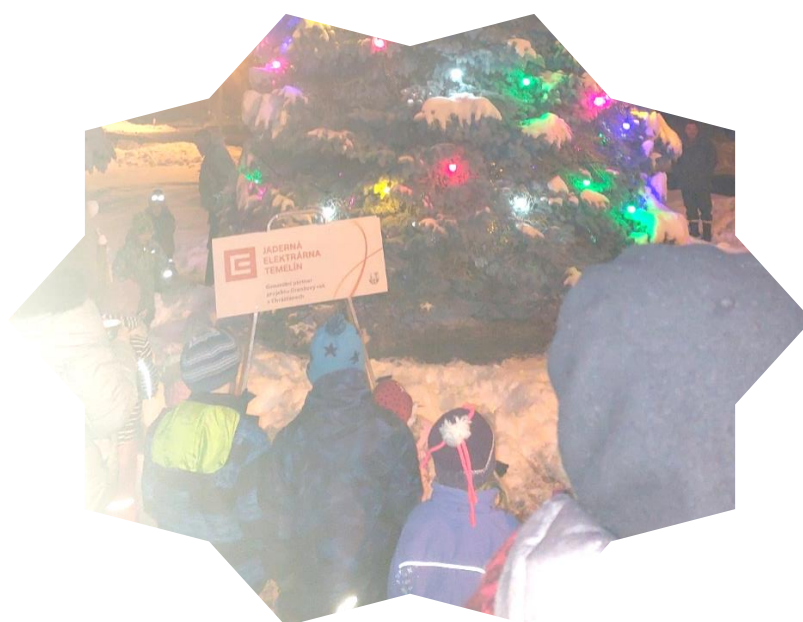
Rozsvěcení vánočního stromu v Chrástanech