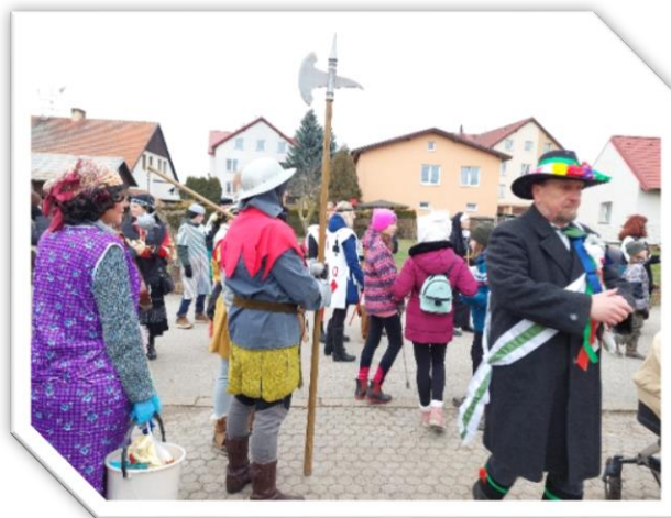
Masopustní průvod Chrástřany