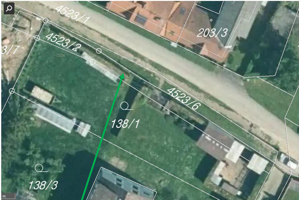
parcels 4523/2 ( 139 m 2 ), k.ú. Chrášťany u Týna nad Vltavou

Záměr bude následně realizován podle místně obvyklých stanovených cen, které jsou v případě prodeje pozemků v minimální výši 100 Kč/m 2 .