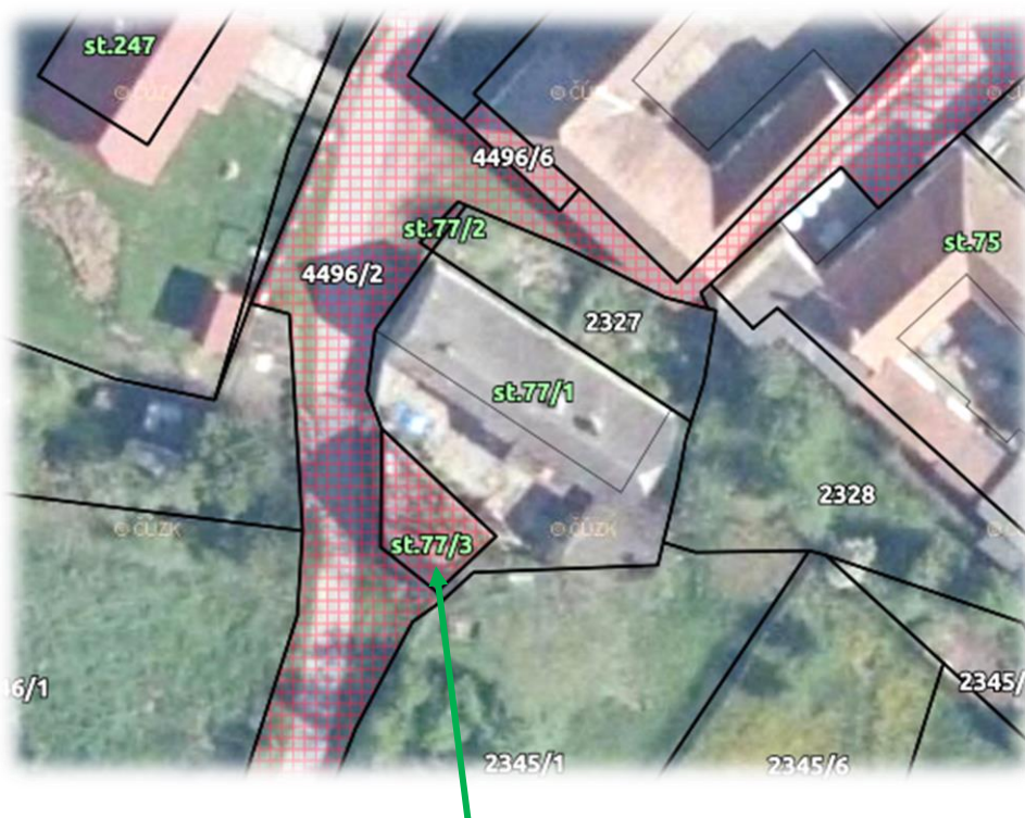
p.č. 77/3 v k.ú. Doubravka u Týna nad Vltavou

- pozemek p.č. st. 77/3 ( 52 m 2 ) – včetně budovy, v k.ú. Doubravka u Týna nad Vltavou