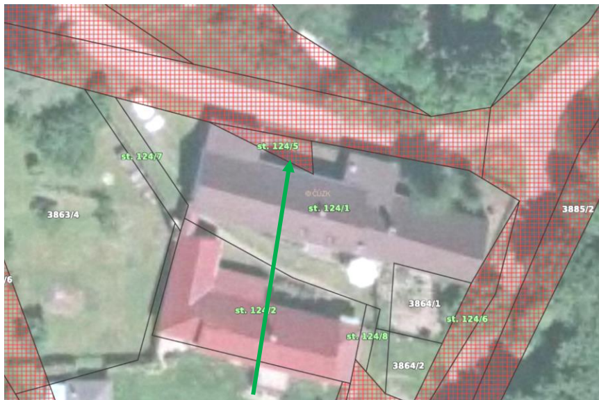
p.č. st. 124/5 v k.ú. Koloměřice