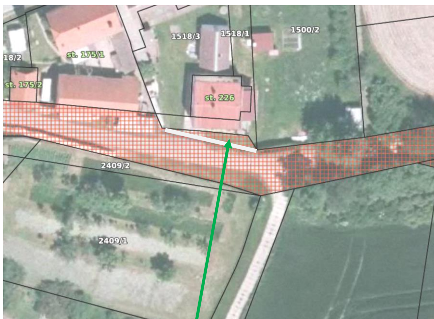
část p.č. 4491/1 v k.ú. Doubravka u Týna nad Vltavou