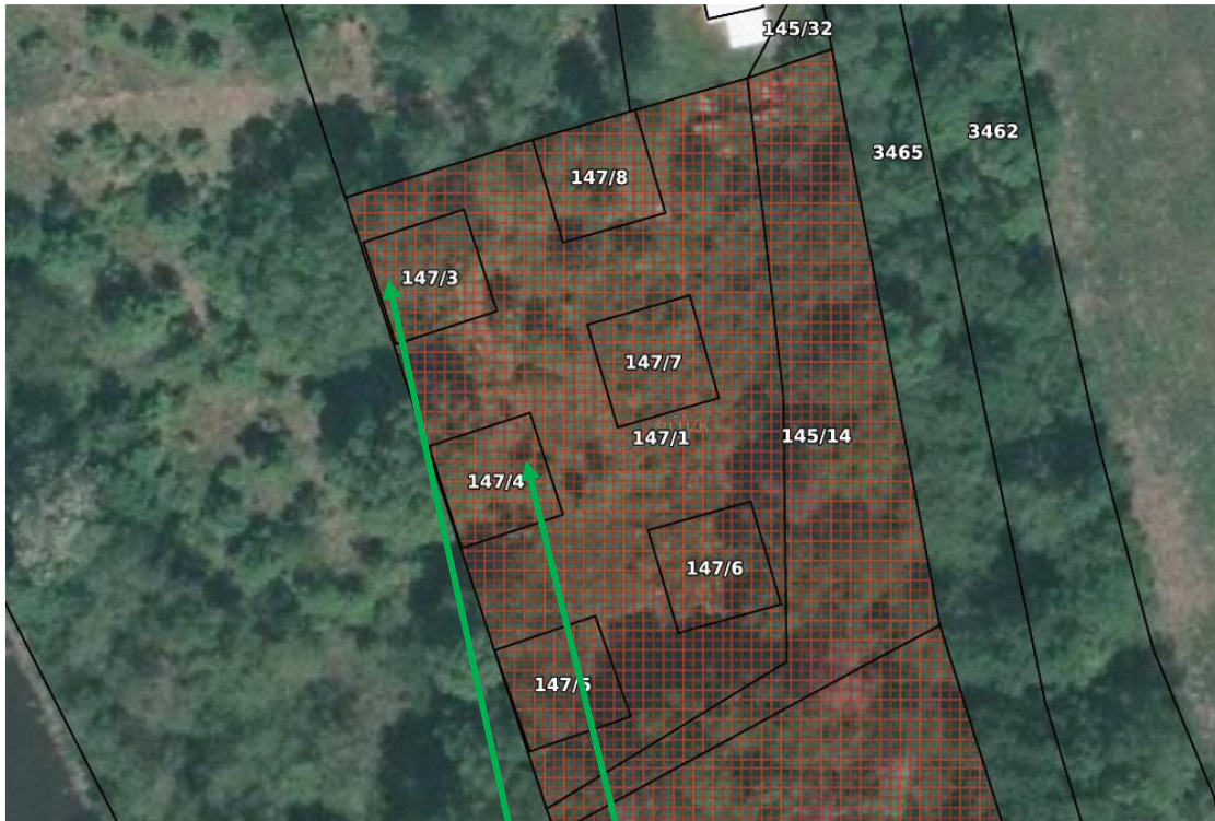
p.č. 147/3 a 147/4 v k.ú. Pašovice