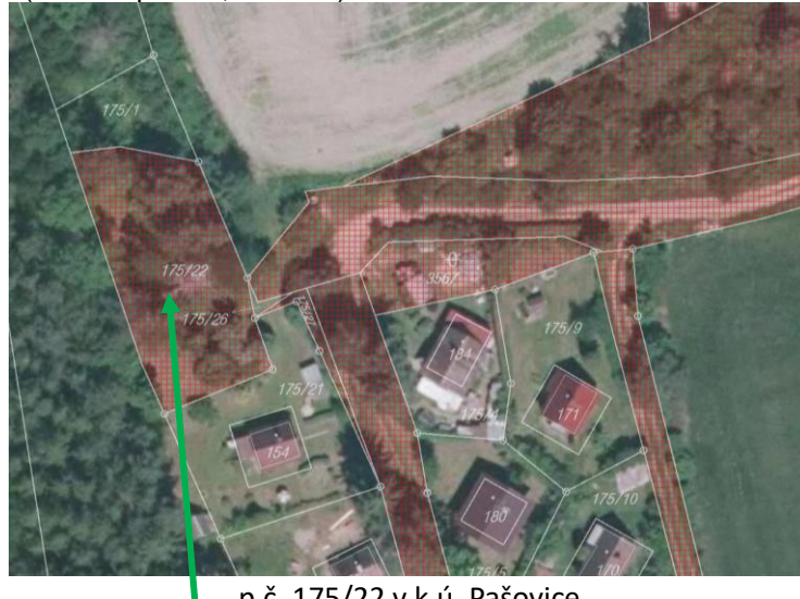
p.č. 175/22 v k.ú. Pašovice