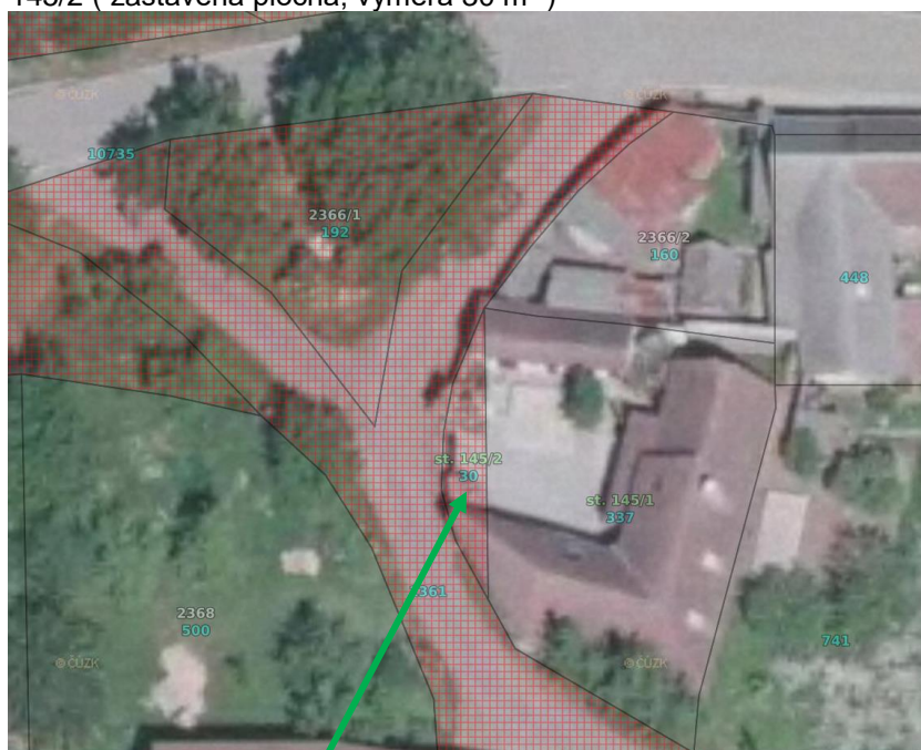
p.č. st. 145/2 v k.ú. Doubravka u Týna nad Vltavou