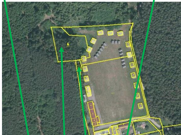
p.č. 1668/2, 1643/2, 1644/2, 1654/5 v k.ú. Dražič

Záměr bude následně realizován podle místně obvyklých stanovených cen, které jsou v případě prodeje pozemků 30 Kč/m 2 pro trvale bydlící obyvatele, 60 Kč/m 2 pro ostatní, 100 Kč/m 2 v případě pozemků v chatové rekreační oblasti. Hodnoty vlastnických podílů v k.ú. Dražič budou určeny znaleckým posudkem.