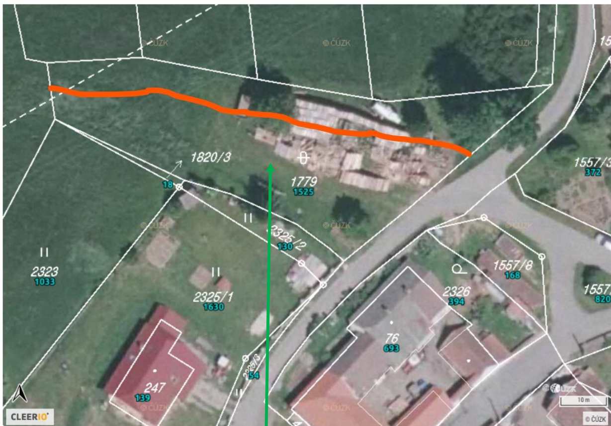
p.č. 1820/3 a část p.č. 1779 v k.ú. Doubravka u Týna nad Vltavou