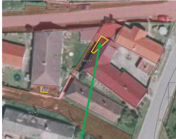
Část p.č. 901/1 v k.ú. Doubrava nad Vltavou