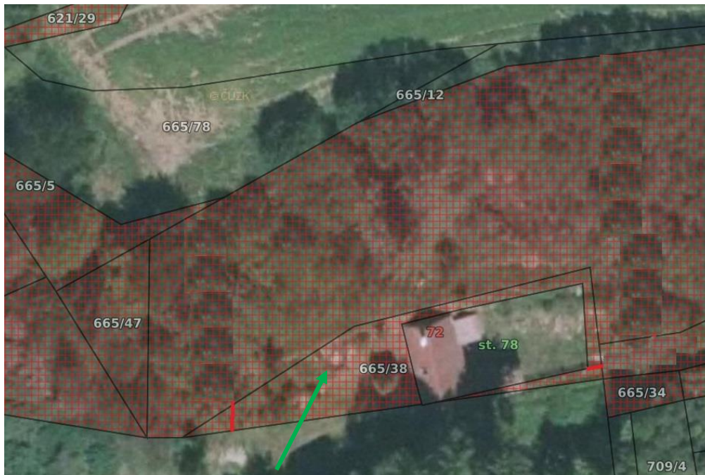
Části p.č. 665/38 v k.ú. Doubrava nad Vltavou